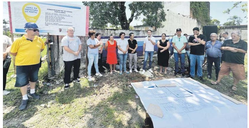
A assinatura da Ordem de Serviço para o início da construção aconteceu na semana passada; outras 43 casas populares serão construídas em diferentes balneários

“Trabalharemos dentro do escopo do plano municipal, implementando uma contribuição financeira por parte dos beneficiários para que o programa não seja integralmente gratuito. Essas taxas são estabelecidas em valores simbólicos, acessíveis mesmo para aqueles de baixa renda ou em situação de vulnerabilidade. Essa abordagem visa garantir o comprometimento dos beneficiários, além de evitar a possibili-