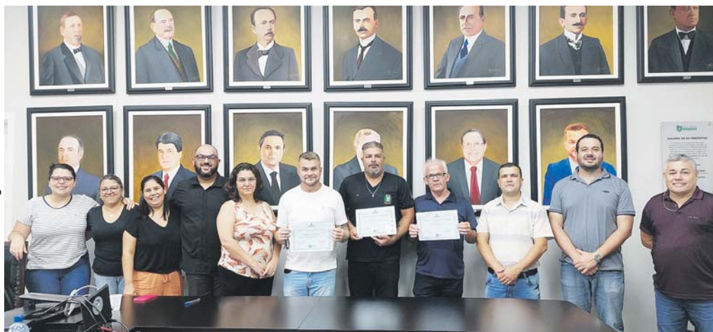
Servidores receberam Certificado de Elogio na Sala de Reuniões da Prefeitura, na semana passada