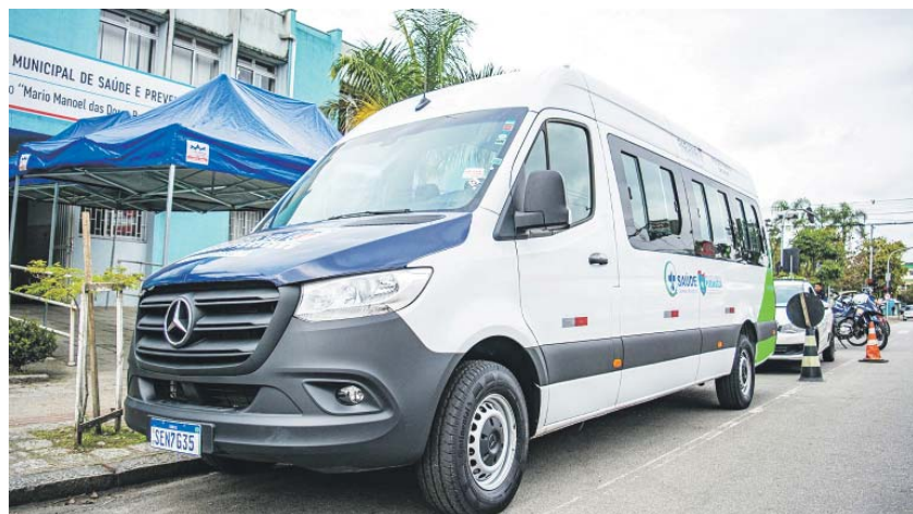
Um dos reforços no transporte de pacientes do TFD, uma van com capacidade para 19 pessoas, foi entregue em julho do ano passado e se somou aos outros 11 veículos que realizam o serviço