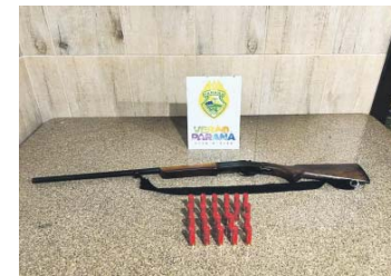
Junto com a espingarda, calibre .28, foram apreendidas 22 munições intactas

Entretanto, ao ser questionada sobre a presença de armas na residência, ela confirmou a existência de uma arma de fogo,