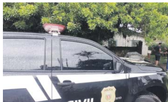
A prisão ocorreu após o cumprimento de mandado de busca e apreensão, em decorrência de diversas denúncias

"No referido local, os policiais civis encontraram um cachorro com sinais de maus-tratos, apresentando sintomas de desnutrição, infestação por carrapatos e pulgas, sujeito a condições de vida manifestamente insalubres. Além disso, foram localizados três pássaros domésticos confinados em gaiolas que se