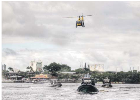
Ao todo, 50 policiais estão envolvidos na ação, entre federais, civis, militares e, ainda, militares da Marinha Brasileira

De acordo com as informações divulgadas no site da Polícia Militar (PM), o levantamento feito pelas forças de segurança foi de que criminosos estão atuando na área portuária para fazer o envio de entorpecentes para outros países, utilizando meios de