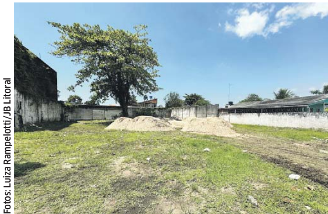
O lote que será o lar para as primeiras sete famílias que serão contempladas com as casas populares fica em Pontal do Sul