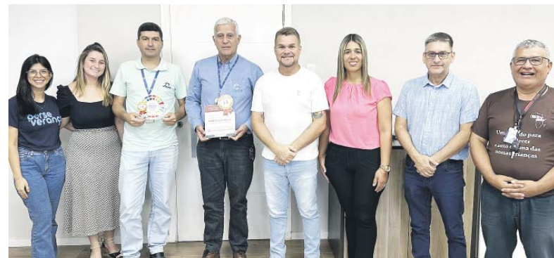
A entrega do selo, parte integrante do Programa Paranaguá Cidade Protegida e Inclusiva, evidencia o comprometimento da empresa com o desenvolvimento econômico e social da comunidade

os fundos do Idoso e da Criança e Adolescente, fortalece a capacidade do município em realizar ações que beneficiam diretamente os mais necessitados. A parceria com empresas comprometidas como a Pasa é fundamental para impulsionar programas e projetos que promovem a inclusão e a proteção dos cidadãos locais", comentou.