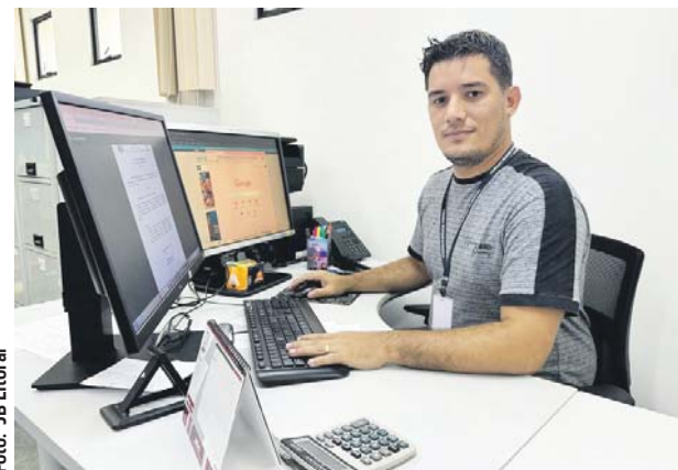
Matinhos conta atualmente com aproximadamente 1.700 servidores efetivos.