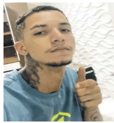
Vítima estava internada desde o dia 13 no Hospital Regional

na UTI (Unidade de Terapia Intensiva), mas, depois de sete dias, não conseguiu se recuperar. Na ocasião, policiais militares foram acionados para se deslocar até a unidade de saúde, onde foram informados que o atentado teria sido motivado por um desentendimento na casa noturna, mas ninguém soube passar informações que pudessem levar a autoria do crime.