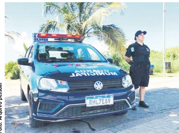
Ela é a primeira mulher a assumir o comando da GCM de Pontal do Paraná