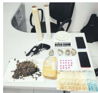
Um revólver calibre 38, além de porções de maconha e comprimidos de ecstasy, foram apreendidos na casa do suspeito

Na identificação de Marllon ainda foi constatado que havia um mandado de prisão em aberto em seu desfavor. Com o outro abordado foi localizado um invólucro contendo maconha, o qual alegou que teria comprado a droga para consumo pessoal.