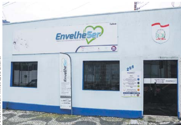
O EnvelheSer funciona de segunda a sexta-feira, em horário comercial, na Rua Manuel Bonifácio, 256, no centro da cidade