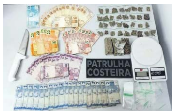
Porções de maconha, balança de precisão, material para embalar entorpecentes e dinheiro foram apreendidos na abordagem

Assim que saiu do local, o motoboy tentou mudar o curso do seu trajeto e, então, os policiais resolveram realizar a abordagem. Em seguida, com o condutor da moto, os militares encontraram um pedaço médio de maconha